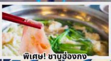
พิเศษ! ชาบูฮ่องกง