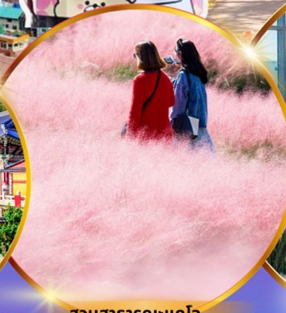
สวนสาธารณะแดโจ