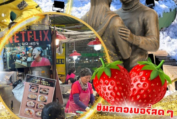
ตลาดกวางจง