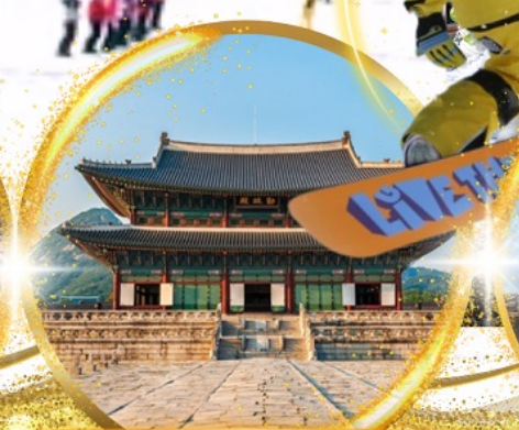
พระราชวังเคียงบกกรุง