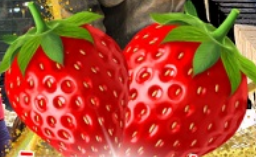
มีผลตอบเอบอจ้สุด ๆ จากรั้