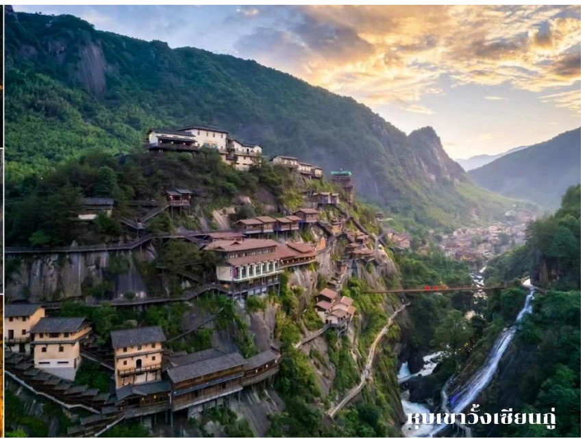
ทิวเขาฉียงเซียงหนู่

ที่พัก 📍 Shangrao jialaite Hotel 4* หรือเทียบเท่า