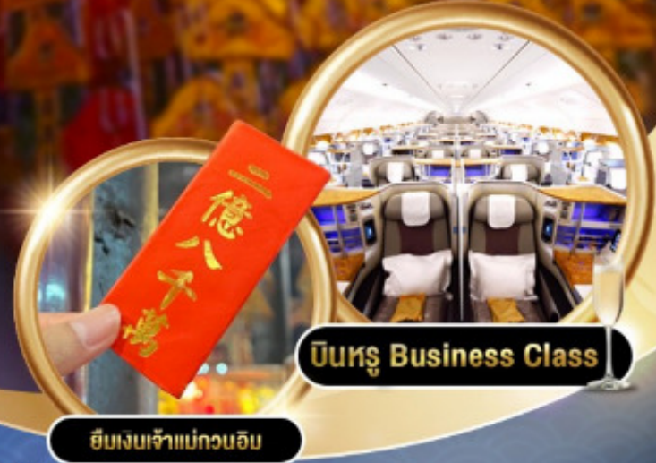
บินหรู Business Class