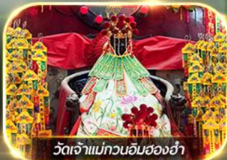
วัดเจ้าแม่กวนอิมสองห้า