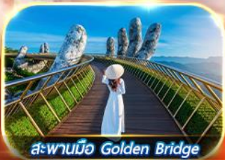
สะพานมือ Golden Bridge