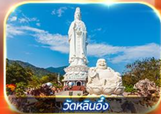
วัดหลินอิ่ง