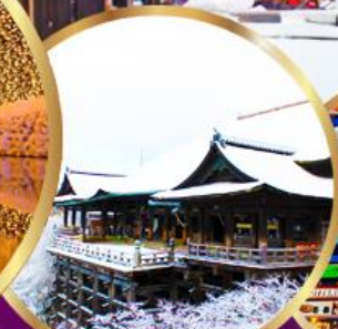
วัด คิโยมิจิ