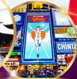
ช้อปปิ้ง ซินโซบาชิ