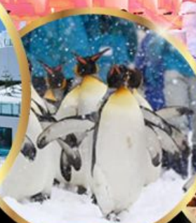
สวนสัตว์ อาซาฮิยาม่า