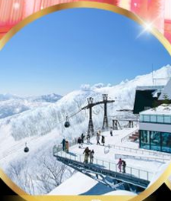
จุดชมวิวก Unkai Terrace