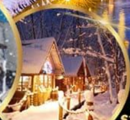
หมู่บ้านเทพนิยาย นิงเกิลเทอเรส