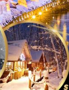
หมู่บ้านเทพนิยาย นิงเกิลเทอเรส