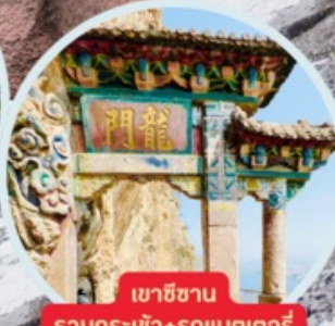
เขาสีซาน รวมกระเช้า+รถแบคเตอร์