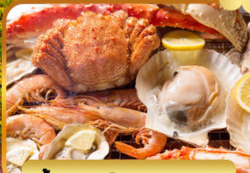
บั้งย่างร้านดังนั้นตะ