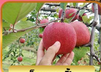
เก็บแอปเปิ้ล