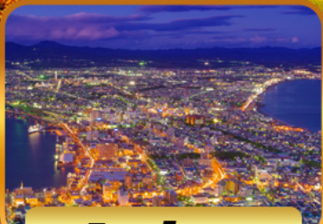
ชมวิวดาโกดาเตะ