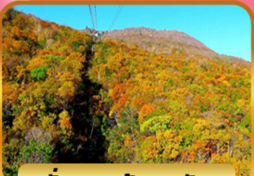
นั่งกระเช้าอุซุซัง