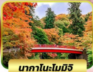
นากาโนะโมมิจิ