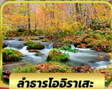
ลำธารโออิราเสะ