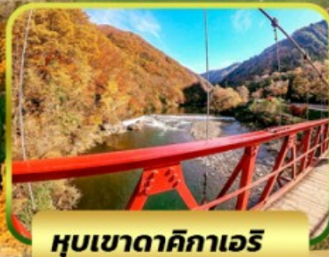
หุบเขาดาคิกาเอริ