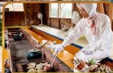
เมนู AMA HUT