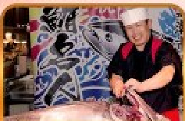
ตลาดปลาคุโรชิโอะ