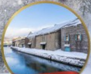
คลองไอตารุ