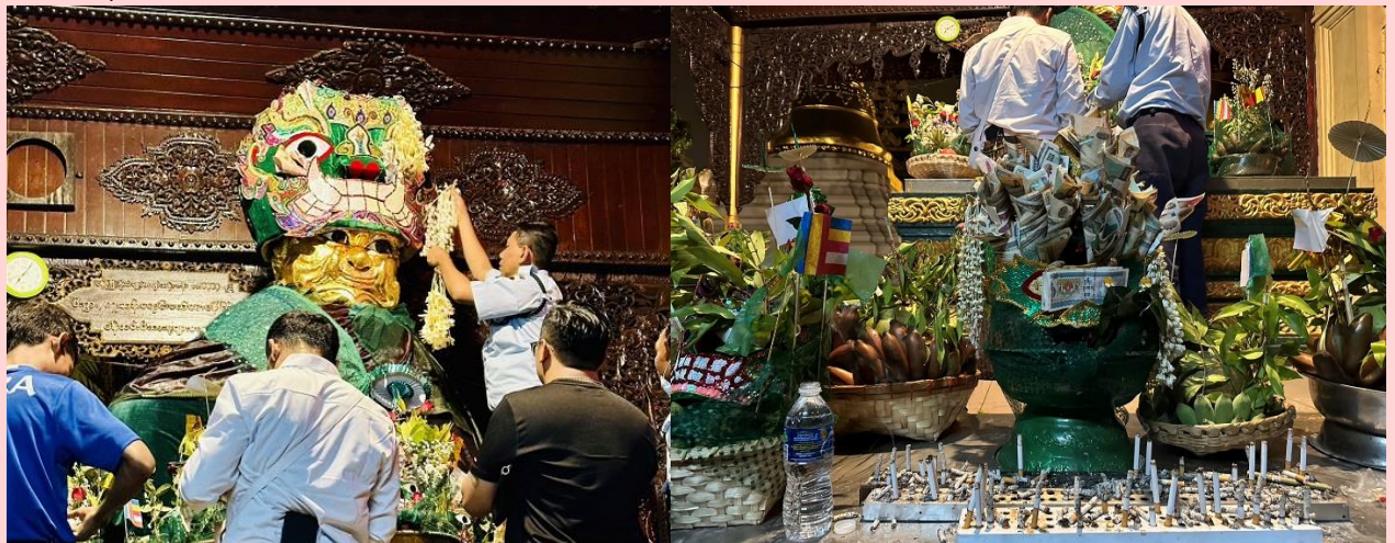
วิธีการขอพรจากแม่ยักษ์

พาท่านเดินไปขอพรที่ แม่ยักษ์ ผู้ปกป้องดูแลเจดีย์ คนพม่าเชื่อว่าแม่ยักษ์... จะช่วยในการตัดกรรมจากเจ้ากรรมนายเวร โดยเฉพาะอย่างยิ่งผู้ที่มีเวรกรรมกับเจ้ากรรมนายเวรทั้งหลายช่วยขจัดเคราะห์กรรม ขจัดอุปสรรค ติดขัดต่างๆ ความสำเร็จอธิษฐานขอให้ท่านช่วย ให้ชีวิตของคุณมีแต่ดีขึ้นเรื่อยๆ ซึ่งถ้าหากคุณกำลังมีทุกข์และหาหนทางไม่ออก ก็ลองมาไหว้ขอพรแม่ยักษ์ให้ช่วยบันดาลให้สิ่งร้ายๆ สิ่งไม่ดี ออกไปจากชีวิต และขอให้ชีวิตมีแต่สิ่งดีๆ เข้ามา นอกจากนี้ยังเชื่อกันว่าแม่ยักษ์... ยังช่วยเรื่องความมีชื่อเสียงโด่งดัง เป็นที่รู้จักก้าวหน้าในหน้าที่การงาน ใครที่ตกงานอยู่ จุดนี้เป็นอีกหนึ่งจุดที่ต้องห้ามพลาด ปล.แม่ยักษ์จะประดิษฐานอยู่ติดกับบันไดประตูทางทิศตะวันออกค่ะ