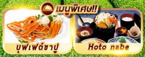
เมนูพิเศษ!!