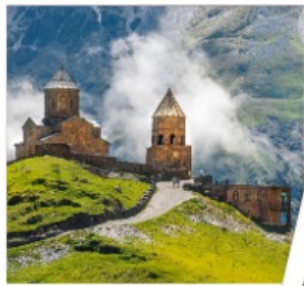
โบสถ์เกอร์เกติ