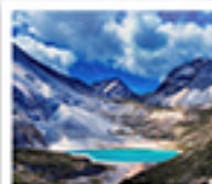
ทะเลสาบน้ำนม