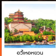
อวิ๋เหอหยวน