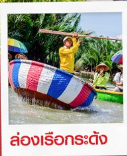
ล่องเรือกระดุง