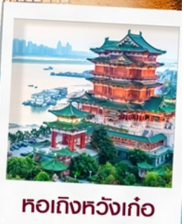
หอถึงหวังเก้อ