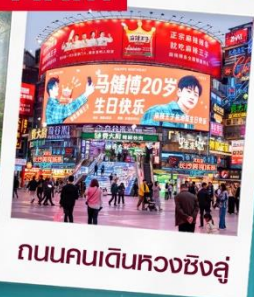
ถนนคนเดินหวงซิงลู่