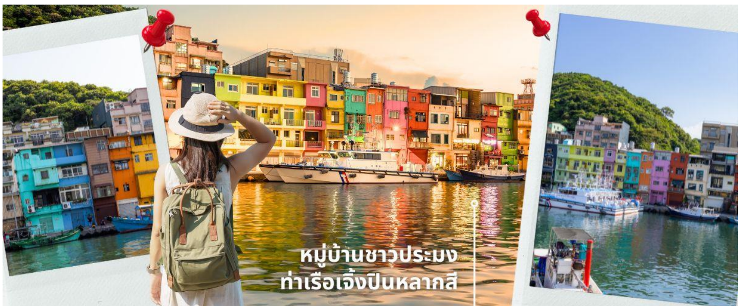
หมู่บ้านชาวประมง ท่าเรือเจิ้งปินหลากสี

นำท่านถ่านรูปสุดชิคที่ ท่าเรือเจิ้งปิน เมืองจีหลง อีกหนึ่งสถานที่ท่องเที่ยวยอดฮิตของเมืองจีหลง (Keelung) ในตอนนี้ น่าจะหนีไม่พ้น ท่าเรือประมงเจิ้งปินเป็นท่าเรือที่ใหญ่ที่สุดในไต้หวัน ทำให้ในยุคแรกๆ ท่าเรือจีหลงเจริญรุ่งเรืองเป็นอย่างมาก สำหรับที่นี่ สวย น่าเที่ยวมากๆ ต้องมาให้ได้ เพราะนอกจากจะมีบ้านหลากสีที่ตั้งอยู่ริมน้ำแล้ว ยังมีคาเฟ่เก๋ๆ มีร้านอาหาร อีกเพียบ