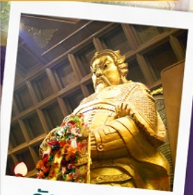
วัดเขาถกหมิว