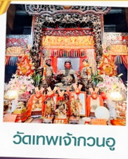
วัดเทพเจ้ากวนอู