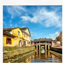
เมืองโบราณฮอยอัน