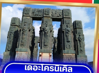
เดอะโครนเคิล ออฟ จอร์เจีย