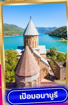
เปอนอนาบูรี