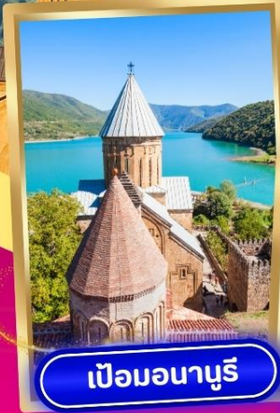
เป็อมอนาบุรี