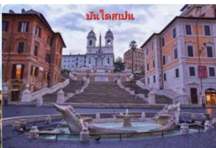
บันไดสเปน