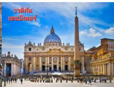
วาติกัน เซนต์ปีเตอร์

บ่าย ...ชม น้ำพุเทรวิ จุดกำเนิดของเสียงเพลง ทร็อคอย่นออฟเดอะฟาวด์เท่น ที่โด่งดัง ชมความสวยงามของงานประติมากรรมหินอ่อนแบบบาร็อก ซึ่งเป็นเรื่องราวของเทพมหาสมุทร ตามตำนานกล่าวไว้ว่าหากใครได้มาถึงน้ำพุแห่งนี้แล้วโยนเหรียญอธิษฐานทิ้งไว้จะได้อีกกลับมาเยือนกรุงโรมอีกครั้งหนึ่ง ...อิสระ เดินเล่นย่านบันไดสเปน แหล่งพักผ่อนของชาวอิตาลีซึ่งเต็มไปด้วยนักท่องเที่ยวหลากหลายเชื้อชาติ..