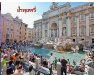
น้ำพุเทรวิ