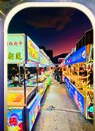
ตลาดอี่หึง