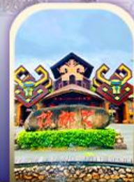
หมู่บ้านชนเผ่า