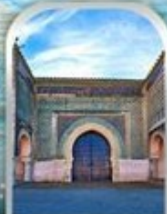
KASBAH OF MOULAY ISMAIL