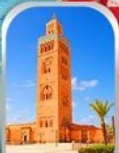
JEMAA EL-FNAA MARRAKESH