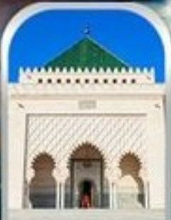
MOHAMMED V SQUARE