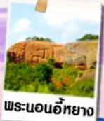
พระนอนอียาง