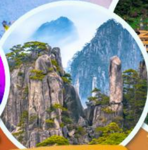
ภูเขาหลวงซาน