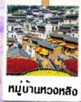
หมู่บ้านหวงหลิง