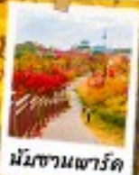
นัมซานพาร์ค