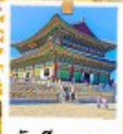
วังเคียงบกทง