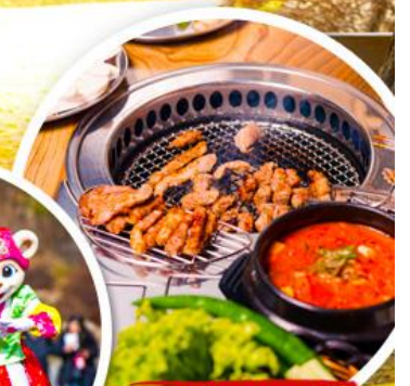
หมูย่างเกาหลี