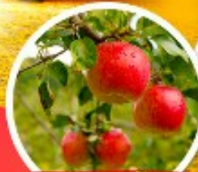
ไร่แอปเปิ้ล