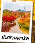
นัมซานพาร์ค