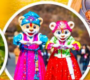
เอเวอร์แลนด์