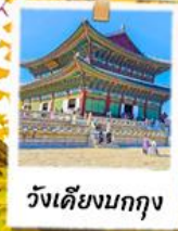
วังเคียงบกกุง