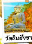
วัดชินฮังซา