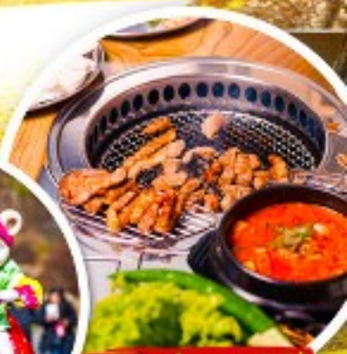
เมนูย่างเกาหลี