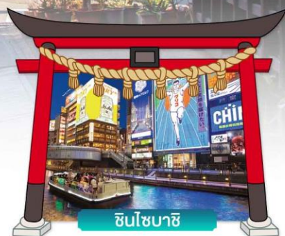
ชินโซบาชิจิ

เดินทางโดยสายการบินแอร์เอเชียเอ็กซ์ 🍴 อาหาร : 6 มื้อ 🏨 โรงแรม : 3 ดาว