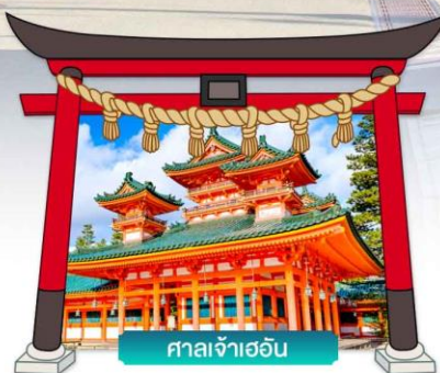
ศาลเจ้าเฮอัน