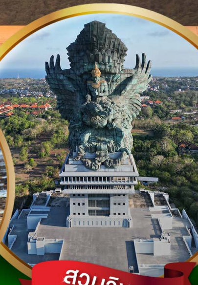
สวนวิษณุ

วิหารทานาคะลอด บ่อน้ำพุศักดิ์สิทธิ์ ไชว์ระบำเกอจัก