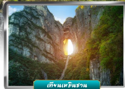
เทียนเหมินชาน