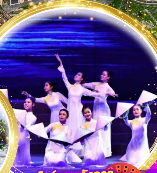
โชว์สุดอลังการ Charming at danang