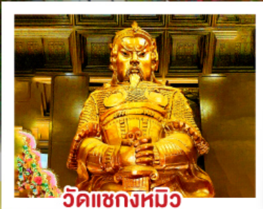
วัดแกลงหมีอ