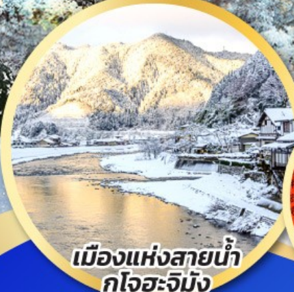
เมืองแห่งสายน้ำ กุโจะจิมัง