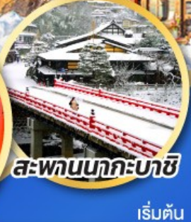
สะพานนากะบาชิ

ชมเมืองแห่งสายน้ำ บรรยากาศย้อนยุค "กุโจะจิมัง"