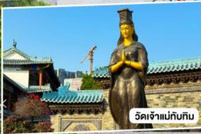
วัดเจ้าแม่กั๊กทิม