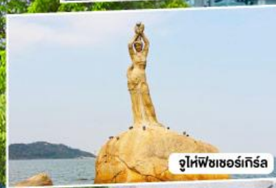
จูไห่ฟิชเชอร์เกิร์ล