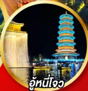
อุ๋หนี่โจว