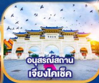
อนุสรณ์สถาน เจียงไคเช็ค