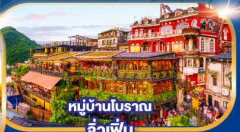
หมู่บ้านโบราณ จิวเฟิน