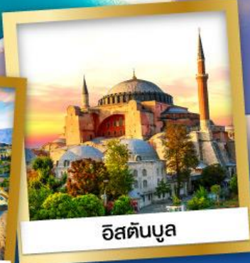
อิสตันบูล