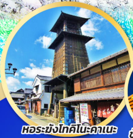
หอรบั้งโทคิโนะคานะ