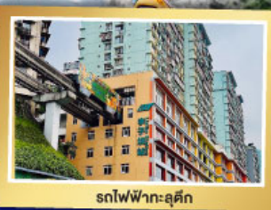
หลงฟอโตเล่อซาน