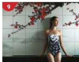
9 Crystal Life™ Spa Rejuvenate mind, body and soul with our holistic Western and Asian spa experience.