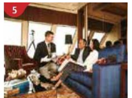
5 The Palace Indulge in European-style butler service and exclusive facilities.