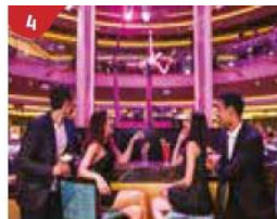
4 Bar 360 Catch live music and aerial acrobatic performances with a glass of champagne.