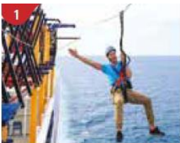
1 Ropes Course & Zipline Feel the thrill of gliding above the ocean on a 35-metre zipline.