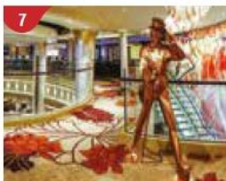
7 Johnnie Walker House™ Immerse yourself in the intricate world of premium Scotch whisky.