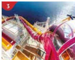
3 Waterslide Park Get drenched in fun on one of our six different waterslides.