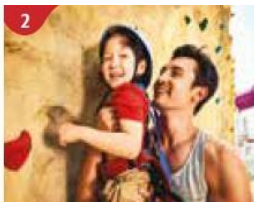
2 Rock Climbing Wall Challenge yourself on our mountainous rock climbing wall.