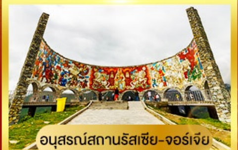
อนุสรณ์สถานรัสเซีย-จอร์เจีย

นั่งรถ 4WD ตะลุยสู่ใจกลางเทือกเขาคอเคซัส | เข้าชมวิหารศักดิ์สิทธิ์ ซามิบา เที่ยวเมืองถ้ำอันเก่าแก่ อพอลิสต์ซิคห์ | พิเศษ มื้ออาหารไทย ณ กรุงทบิลีซี