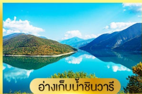
อ่างเก็บน้ำชินวารี