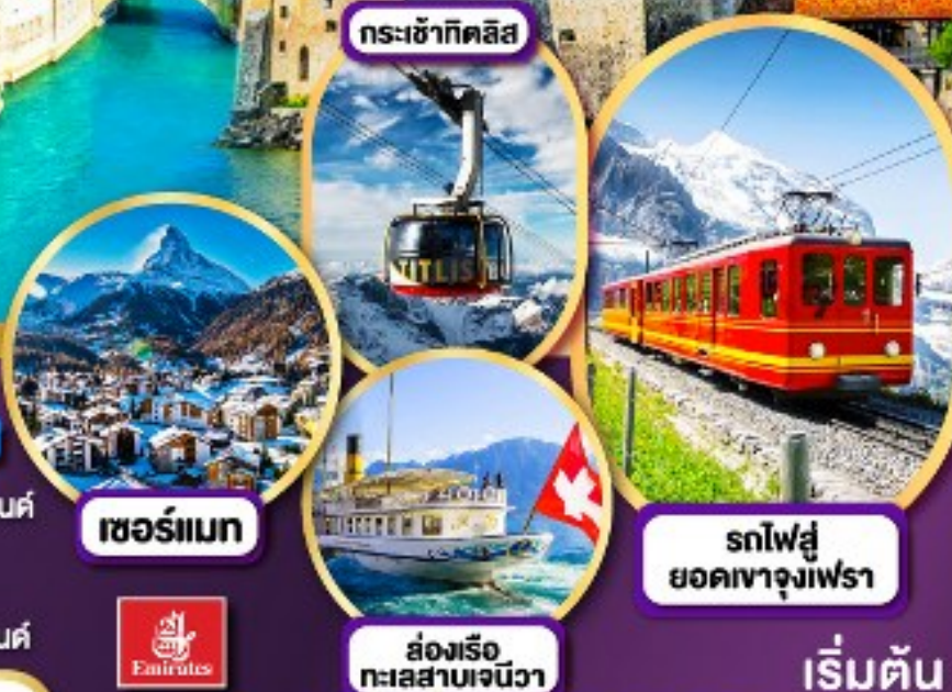
กระเช้ากิตลิส