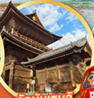
วัดนินเซินจิ