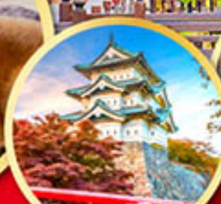
ปราสาทฮิโรซากิ