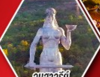
อนุสาวรีย์