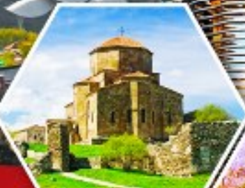
วิหารจอร์เจีย

ฟรี ประกันสุขภาพ และอุบัติเหตุ 3 ล้านบาท *คุ้มครองสูงสุด *มีเงื่อนไขและข้อยกเว้น *รายละเอียดดูใบรับประกัน