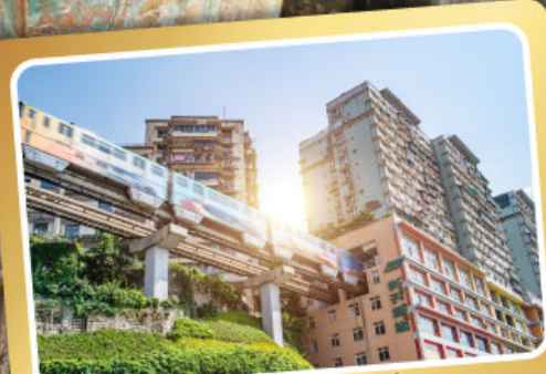
รถไฟฟ้าทะลุตึก