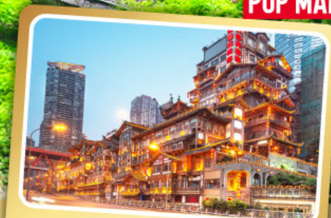
หงหย่าต้ง