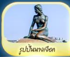
รูปปั้นนางเงือก