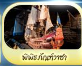
พิพิธภัณฑ์ทิวาซ่า